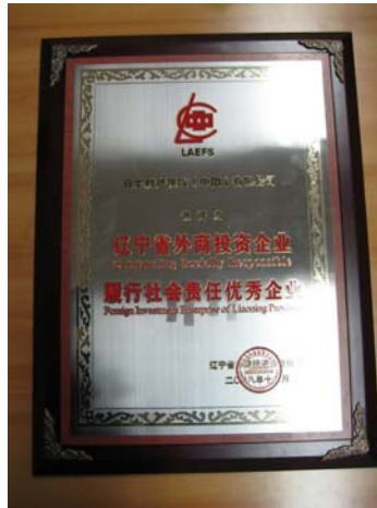
★图为本公司荣获的“辽宁外商投资企业履行社会责任优秀企业”奖牌

2008年10月,辽宁省外商投资企业协会发布《关于表彰辽宁省外商投资企业履行社会责任优秀企业的通知》,决定授予省内50家外商投资企业“辽宁外商投资企业履行社会责任优秀企业”称号,日本财产保险(中国)有限公司为获得此荣誉称号的50家企业之一,也是唯一的保险公司。