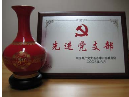
★图为中山区委党工委向本公司颁发的奖杯、奖牌

企党委，经过3年的发展，支部共有党员33名，占大连总公司员工人数的40%。截至目前，公司共发展了3名党员，并帮助2名预备党员顺利转正为正式党员。本公司党支部成立后，坚持科学发展观，通过多种形式，积极帮助企业不断完善管理，使公司的本地化建设踏实有效地推进，达到前所未有的高度。