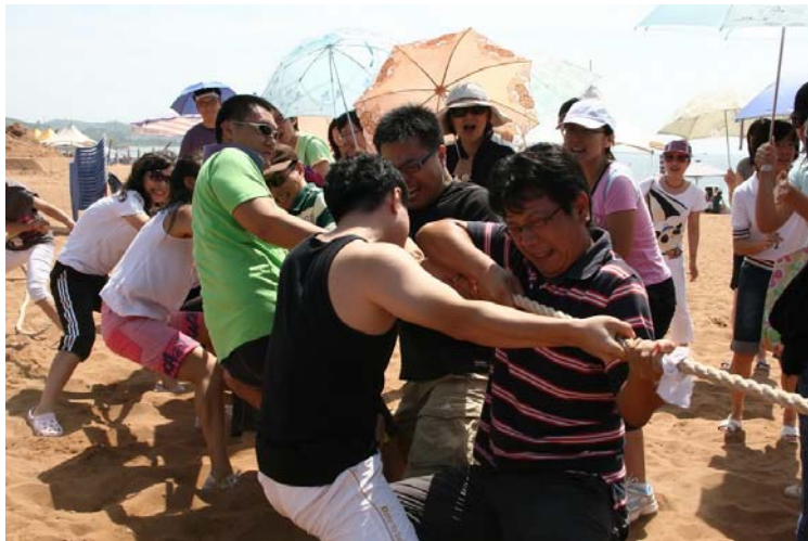
★公司沙滩啤酒会传统保留项目拔河比赛精彩瞬间

公司沙滩啤酒会每年夏季举办，至今已连续举办了五届。该活动使员工在工作之余得到了充分的放松，同时也促进了员工与领导层之间、员工与员工之间的交流，增强了集体的凝聚力。