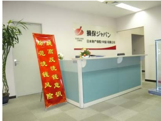
★ 图为本公司前台处醒目的反洗钱标识