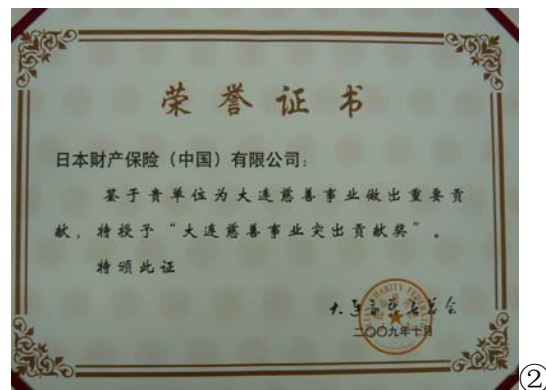
★②本公司获得的荣誉证书