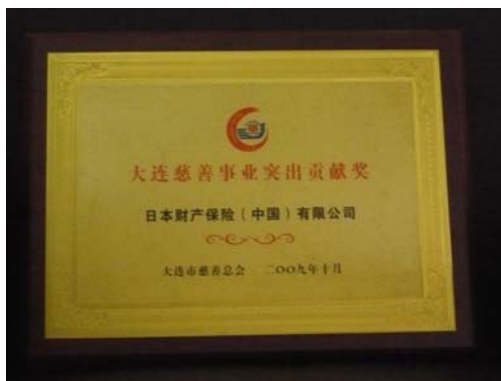
★ ①本公司获得的奖状

在 10 月 31 日召开的大连市第二次慈善大会上，日本财产保险（中国）有限公司因在汶川发生大地震后，积极捐款，支持灾区重建而荣获大连市慈善总会颁发的“大连慈善事业突出贡献奖”。2008 年 5 月 12 日，四川省汶川县发生强烈地震后，大连总公司积极为灾区捐款。5 月 14 日，公司通过大连慈善总会向灾区捐款人民币 52.88 万元，在大连市各保险公司中名列第一。